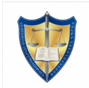
17.09.2013 ՀԱՅՏԱՐԱՐՈՒԹՅՈՒՆ - 2013 ԹՎԱԿԱՆԻ ՍԵՊՏԵՄԲԵՐ ԱՄՍՎԱ ԴԱՍԸՆԹԱՑՆԵՐ