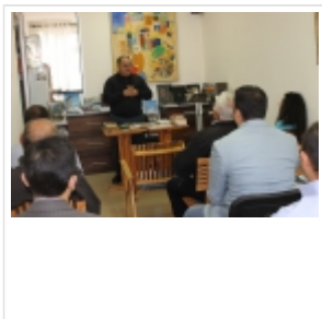
09.10.2013 ԱՎԱՐՏՎԵՑ «ՍՏՐԱՏԵԳԻԱՅԻ ԱՐՎԵՍԸ» ԹԵՄԱՅՈՎ ՎԵՐԱՊԱՏՐԱՍՏՄԱՆ ԴԱՍԸՆԹԱՑԸ