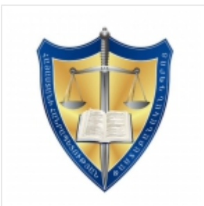
30.09.2013 ԴԱՍԸՆԹԱՑՆԵՐԻ ՓՈՓՈԽՈՒԹՅՈՒՆ