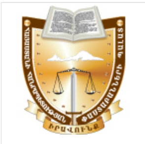
17.09.2013 ՍԵՊՏԵՄԲԵՐ ԱՄՍՎԱ ՎԵՐԱՊԱՏՐԱՍՏՄԱՆ ԴԱՍԸՆԹԱՑՆԵՐ