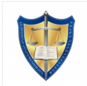
30.09.2013 «ՍՏՐԱՏԵԳԻԱՅԻ ԱՐՎԵՍԸ» ԹԵՄԱՅՈՎ ԴԱՍԱԽՈՍՈՒԹՅՈՒՆ