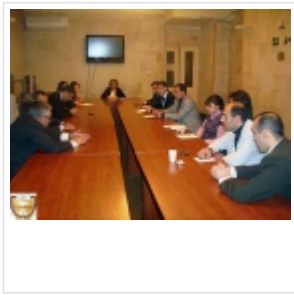
22.11.2013 ՓԱՍՏԱԲԱՆՆԵՐԻ ՊԱԼԱՏԻ ԱՎՈՒՄՐՈՒՄ ՔՆՆԱՐԿՎԵԼ Է ՓԱՍՏԱԲԱՆԱԿԱՆ ԳՈՐԾՈՒՆԵՈՒԹՅԱՆ ԻՐԱԿԱՆԱՑՄԱՆ ԱՌԱՆՁՆԱՀԱՏՎՈՒԹՅՈՒՆՆ ԵՐԸ