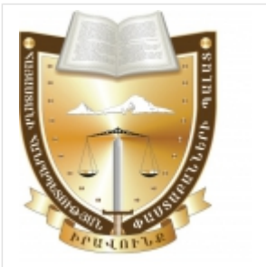
27.11.2013 ՓԱՍՏԱԲԱՆՆԵՐԻ ՊԱԼԱՏԸ ՔԱՂԱՔԱՑԻՆԵՐԻՆ ԻՐԱՎԱԲԱՆԱԿԱՆ ԽՈՐՀՐԴԱՏՎՈՒԹՅՈՒՆ