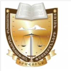
19.11.2013 ՇՆՈՐ ՀԱՎԱԼԱԿԱՆ ՆԱՄԱԿ ՓԱՍՏԱԲԱՆՆԵՐԻ ՊԱԼԱՏԻՆ